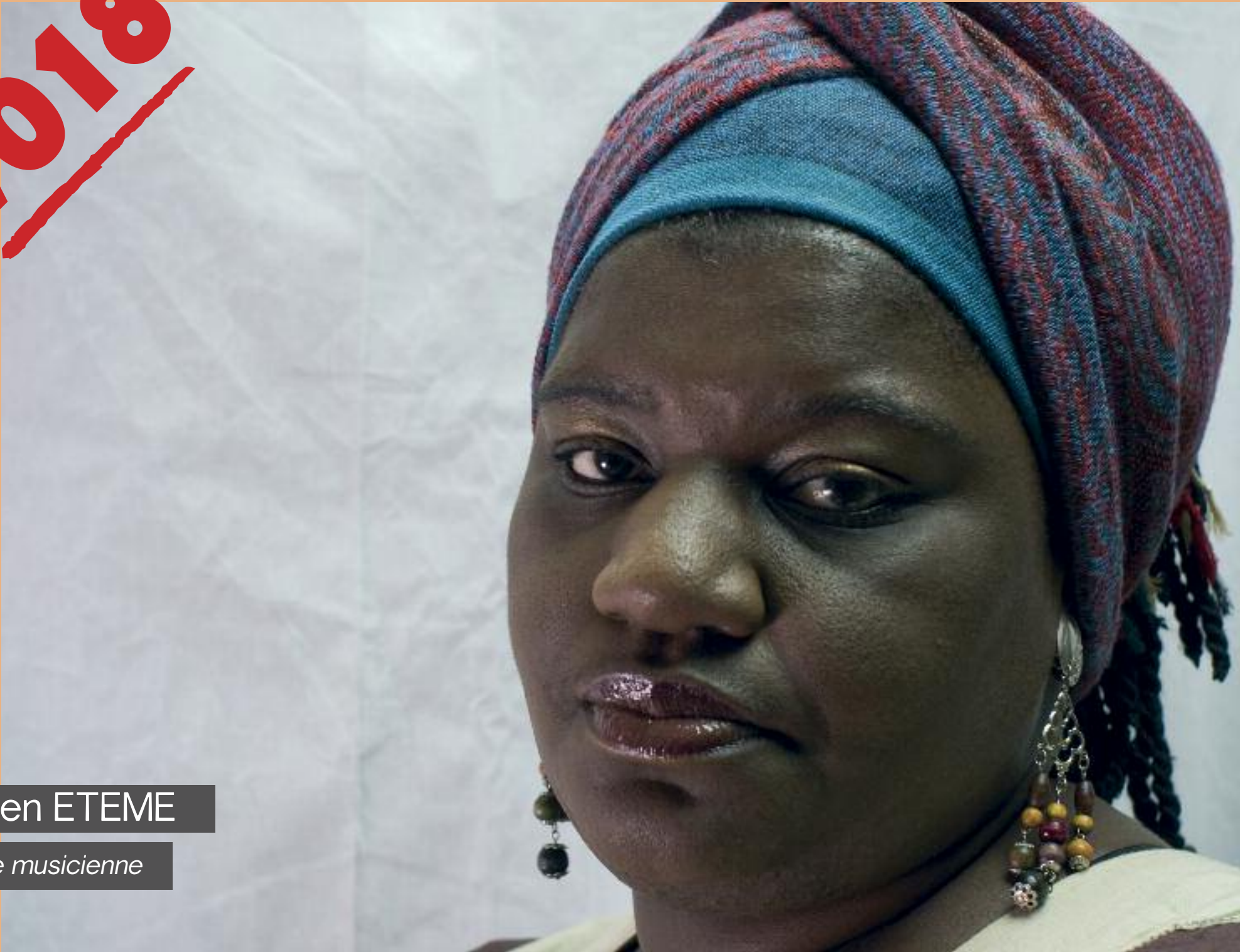
Queen ETEME Artiste musicienne

“ Toute personne, en particulier les jeunes de moins de 18 ans, doit être protégée contre toute les formes d’inceste, en particulier l’exploitation sexuelle. ”